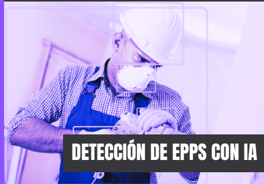
DETECCIÓN DE EPPS CON IA