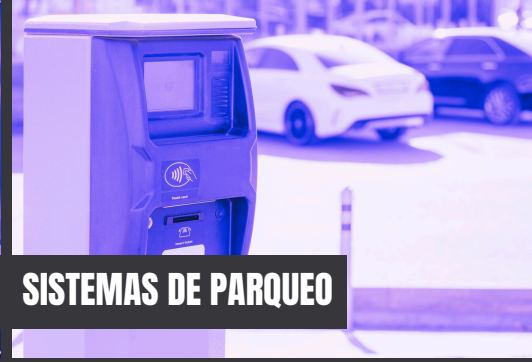
SISTEMAS DE PARQUEO