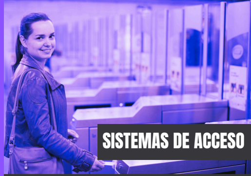
SISTEMAS DE ACCESO